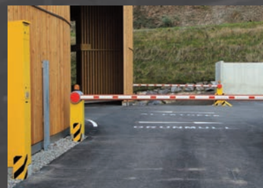
Einfahrt mit Kartenterminal