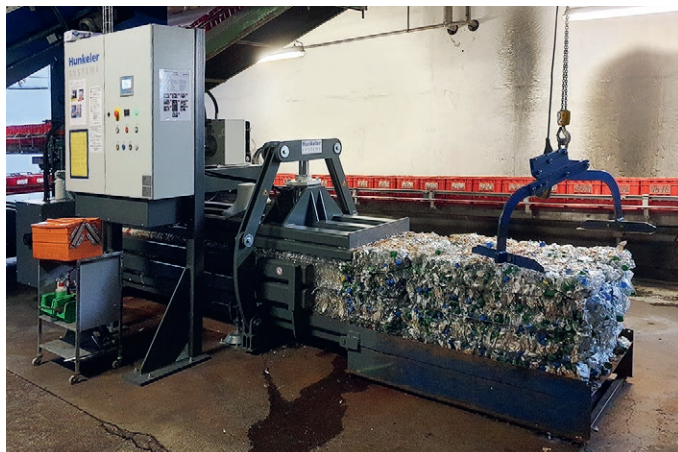
Une nouvelle presse à balles pour PET avec un module Compactor remplace l'installation de l'année 2005.

Le Hunkeler Kompakt Aircleaner est rapidement installé. Il fonctionne de manière économique, pour son fonctionnement suffit un raccordement 230 Volt. Un signal lumineux indique que les filtres sont saturés, lesquels sont échangés en quelques gestes. Le préfiltre est changé en moyenne tous les six mois, le filtre principal une fois par année.