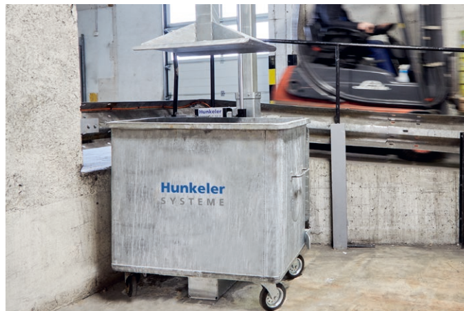
Benne autocompactante: Le volume des déchets, qui était autre fois cinq, a été réduit à deux conteneurs par semaine.

L'entreprise travaille en plus avec une presse à conteneurs. Les déchets qui sont évacués dans les conteneurs sont com-